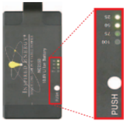
18時間動作のリチウムイオンバッテリー (残量表示機能付き)