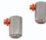
高精度 15MHzトランスデューサーにも対応