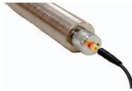
マグネット式トランスデューサー