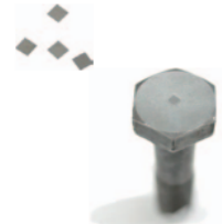
チップ式トランスデューサー